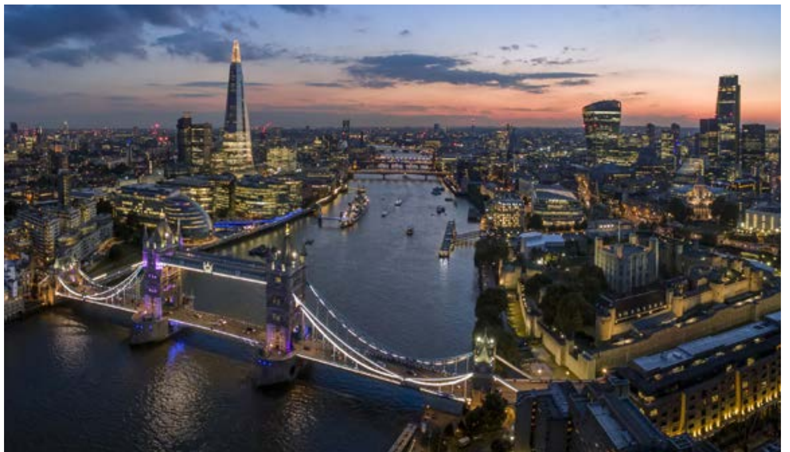
El horizonte de Londres al atardecer exhibe una impresionante mezcla de arquitectura histórica y moderna, con puntos de referencia icónicos como The Shard y el Tower Bridge a lo largo del río Támesis. Es un paisaje urbano vibrante que destaca el bullicioso distrito financiero del Reino Unido contra un cielo dramático.

Mi primera parada, después de un rápido check-in en un encantador hotel, fue el Museo Británico. Aquí podrías pasar fácilmente días, si no semanas. La Piedra Rosetta, los Mármoles de Elgin, las momias egipcias; cada artefacto susurraba historias de civilizaciones antiguas. Me sentí hipnotizado por la magnitud de la historia humana contenida entre esas paredes. Fue una experiencia humilde, darme cuenta de cuántas vidas y culturas habían pasado, dejando atrás estos increíbles tes-