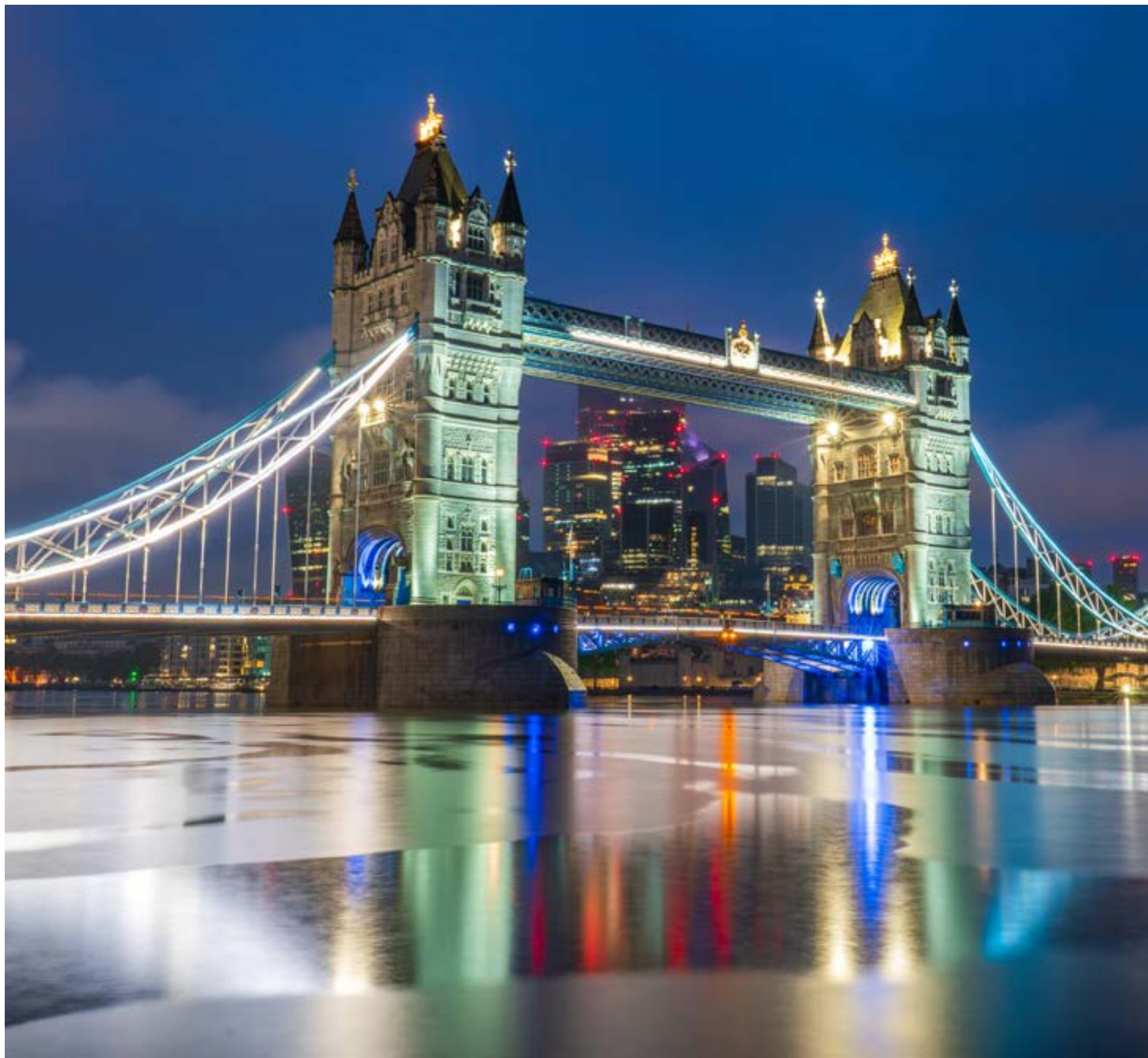
Tower Bridge de Londres se ilumina al anochecer, reflejando sus brillantes luces sobre las tranquilas aguas del río Támesis. Esta imagen captura la arquitectura victoriana en contraste con el horizonte moderno de la ciudad, creando una escena cautivadora.

ras (y a veces macabras) historias del pasado de la Torre, desde prisioneros reales hasta ejecuciones. Ver las Joyas de la Corona brillar con tanta brillantez fue asombroso, un crudo recordatorio del poder y la riqueza perdurables de la monarquía. Los Cuervos, con su legendario papel en la protección de la Torre, añadieron a la mística. Caminando por las diversas