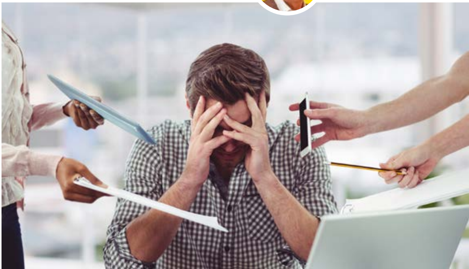
Aumento en los niveles de estrés y ansiedad, son las causas de la polarización

la polarización es creciente, la violencia aumenta cada día en más regiones, la sobreexposición a la información política, a los temas sensibles de justicia, paz puede afectar la convivencia al generar tensiones en las relaciones interpersonales, así como influir en las costumbres al modificar la forma en que percibimos el mundo que nos rodea.