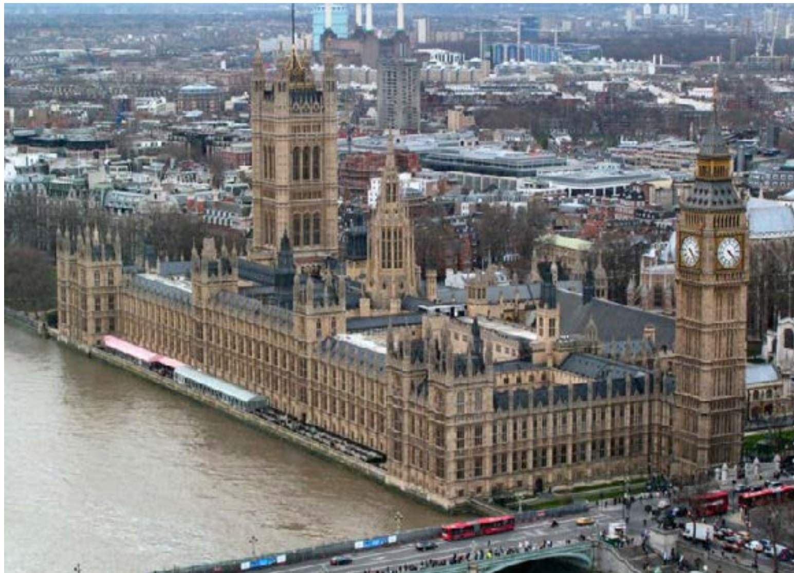
El Palacio de Westminster en Londres alberga la icónica Torre Elizabeth, popularmente conocida como Big Ben. Este famoso nombre, en realidad, se refiere a la enorme Gran Campana que se encuentra dentro de la torre del reloj, no a la torre en sí.