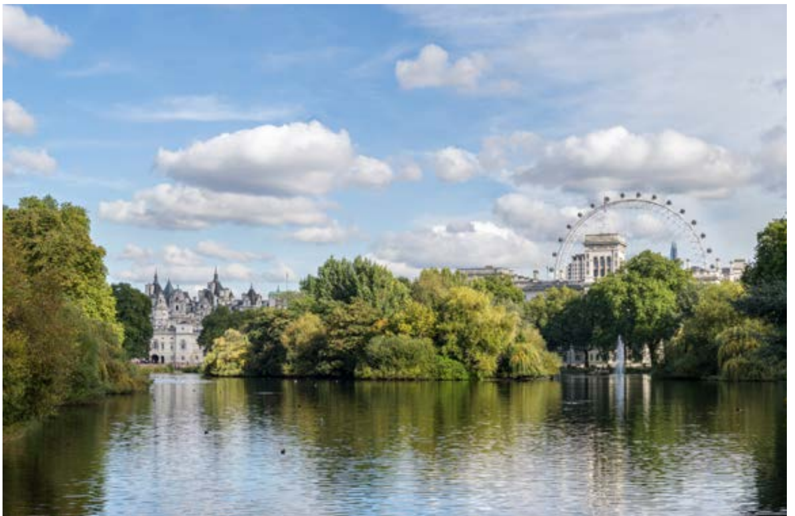
St. James's Park es un oasis verde en el corazón de Londres, conocido por sus vistas pintorescas del Palacio de Buckingham y su tranquilo lago habitado por pelícanos. Ofrece un escape sereno del bullicio de la ciudad.

La tarde me llevó a la Torre de Londres, un lugar sinónimo de intriga y oscura historia. Los Yeoman Warders, o «Beefeaters», con sus uniformes distintivos, compartieron cautivado-