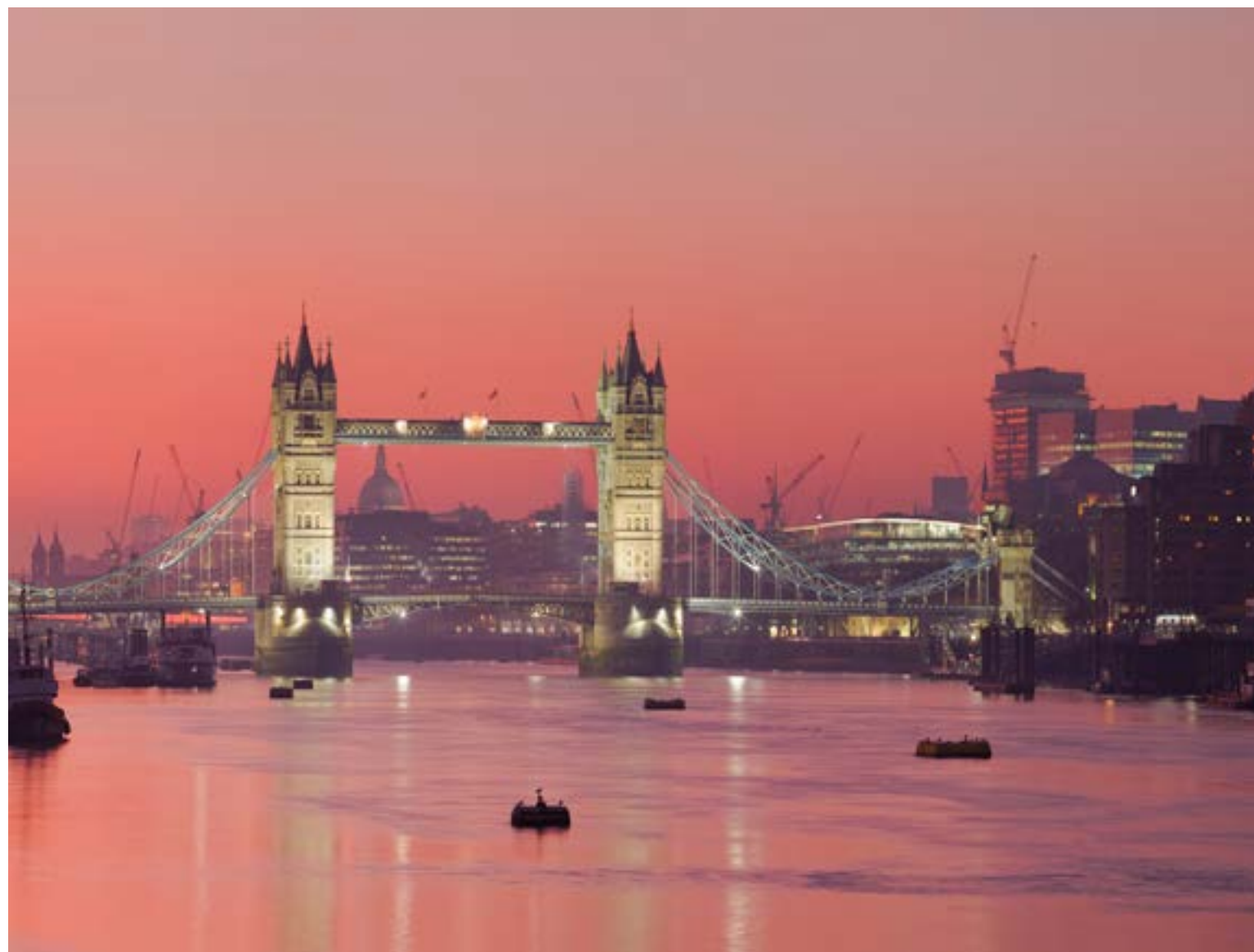
El nombre Londres podría tener sus raíces en el río Támesis, sugiriendo una conexión timológica directa con la antigua designación del río.

facético: historia antigua, modernidad bulliciosa y rincones inesperados de tranquilidad.