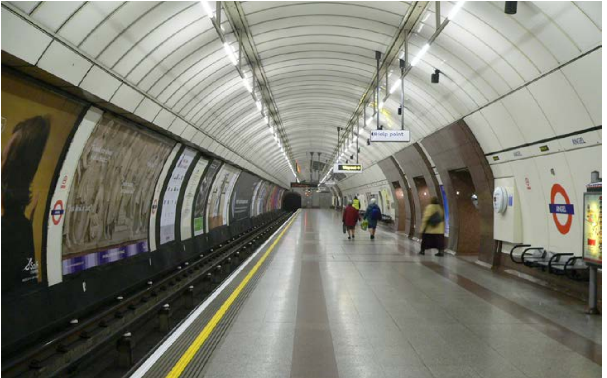
La estación Angel del Metro de Londres cuenta con una plataforma extragrande hacia el sur, resultado de una expansión en 1992 para combatir el hacinamiento. Se excavó un nuevo túnel para la plataforma norte y la original de 9 metros se reconstruyó para la plataforma sur, mejorando drásticamente el flujo de pasajeros.

Para el almuerzo, me aventuré en el bullicioso Borough Market, un paraíso para los amantes de la comida. La atmósfera vibrante, los aromas tentadores y la infinita variedad de productos artesanales, comida callejera e ingredientes frescos fueron un festín para los sentidos. Probé un delicioso toastie de queso gourmet y unas ostras recién abiertas, empapándome de la animada energía del mercado. Era un verdadero crisol de culturas y sabores, mostrando la diversa escena culinaria de Londres.